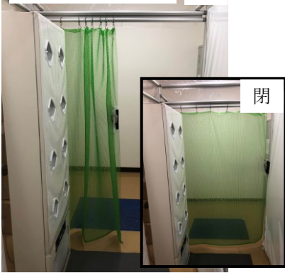
カーテン状展張例 開